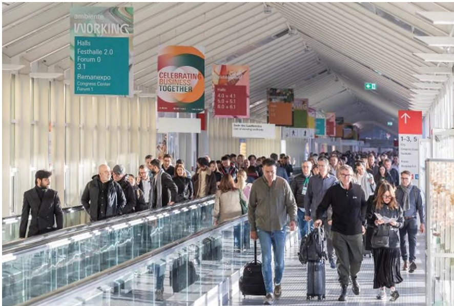
Ambiente、Christmasworld 和 Creativeworld 三大展聯袂呈現了一場全球消費品產業的盛大聚會

法蘭克福，2024 年 1 月 30 日。2024 年，全球消費品產業年度盛事再度啟幕，法蘭克福展覽集團旗下三大領先消費品展：法蘭克福國際春季消費品展覽會（Ambiente）、法蘭克福國際聖誕禮品世界博覽會（Christmasworld）和法蘭克福 DIY 手工製作及創意文具展覽會（Creativeworld）以「共襄商業盛典（Celebrating Business Together）」為主旨，共同建構起規模空前的國際消費品貿易平台。此次展會創下多項歷史記錄：參展商數量較上屆增長 10%，共有 4,928 家展商在超過 36 萬平方米的展出面積上展示了他們的最新產品。儘管受到數日鐵路罷工的影響，這場在法蘭克福展覽中心有史以來規模最大的展會，依然憑藉其呈現的豐富趨勢和創新內容，吸引了約 14 萬名來自各行各業和不同銷售管道的專業觀眾。作為消費品產業的國際交流和商貿平台，該展會匯集了超過 170 個國家和地區的觀眾，針對當前市場所面臨的各項挑戰，提供了專業指導、靈感啟發以及解決方案。